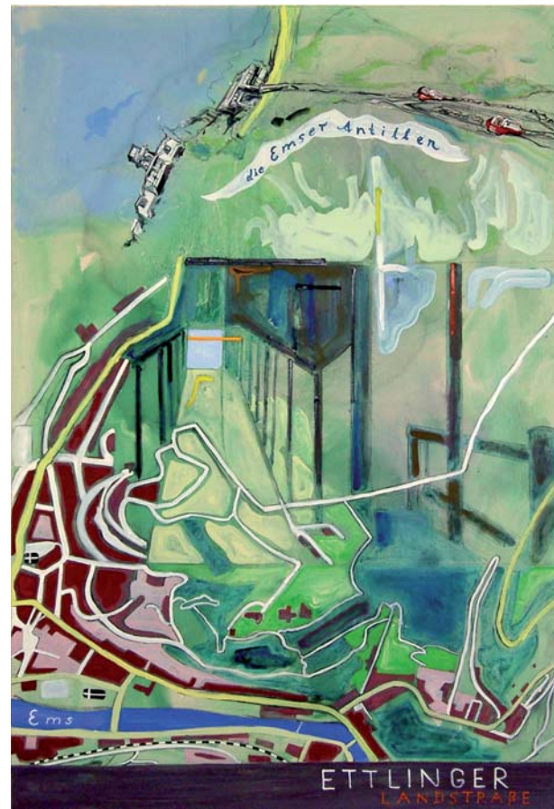
Stefan Ettliger, Hochebene, 2006 © VG Bild-Kunst, Bonn 2010, Foto: Achim Kukulies