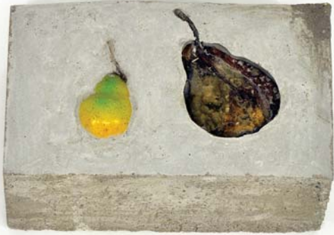
Yin Xiuzhen, Landscape, 1999 (Detail) © Yin Xiuzhen, Foto: Ursula Rudischer

15 Jahre wird das Künstlerhaus Schloß Balmoral alt – Grund genug, anhand ausgewählter Werke aller Jahrgänge das künstlerische Schaffen im Experimentallabor Balmoral zu beleuchten. Das Künstlerhaus wird von der Stiftung Rheinland-Pfalz für Kultur getragen und fördert internationale bildende Künstlerinnen und Künstler durch Stipendien.