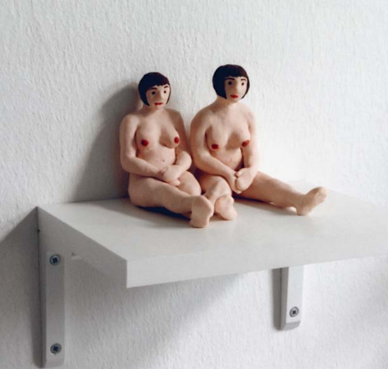
Heather Allen, Naked Pair, 2000 © VG Bild-Kunst, Bonn 2010